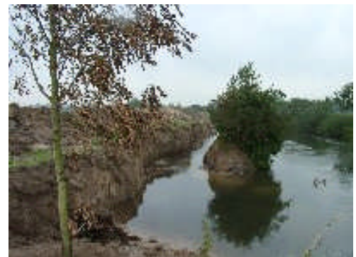
Renaturierte Lippe mit neuem Steilufer

2011: Abschluss des Verfahrens am 8.11.2011