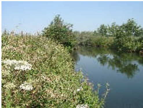
Lippe oberhalb von Lippstadt